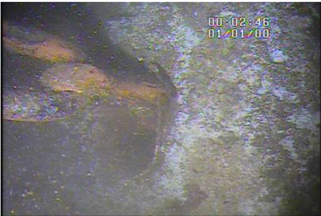
Chaîne détériorée typique au niveau d'un trou de brise-lame (partie inférieure d'un brise-lame de béton)