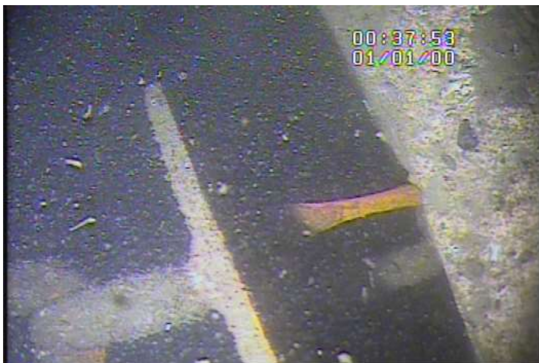
Chaîne détériorée typique au niveau d'un point d'ancrage en béton (on peut aussi voir la plaque de verrouillage du point d'ancrage)